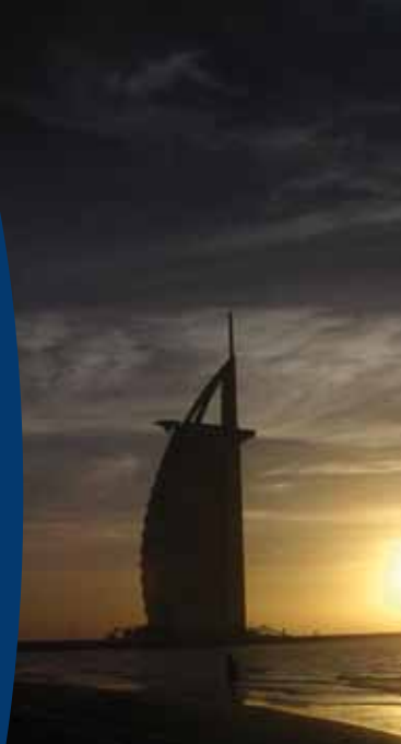
Hotel Burj al Arab, Dubai

agentur contact IDL London • Berlin • Leipzig Verena Rahmig • Fon +49. (0)170. 860 55 70 vr@kunsthhaus-leipzig.de